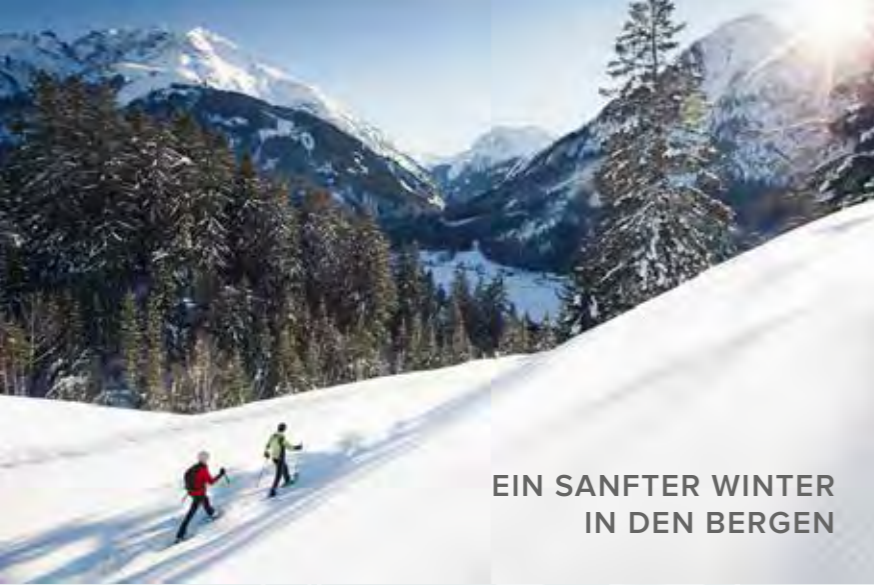
EIN SANFTER WINTER IN DEN BERGEN